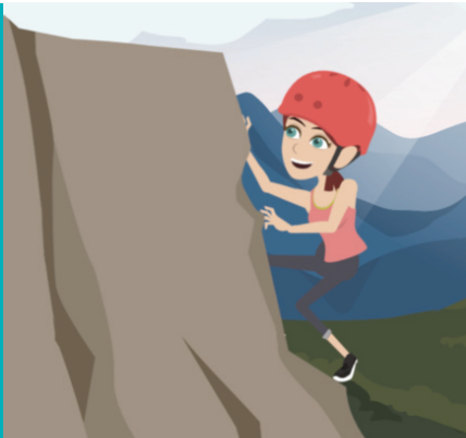
j'escalade les rochers